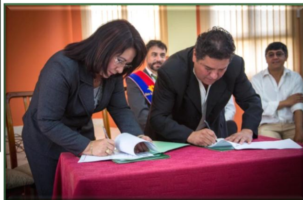
Firma de Acuerdo con la Subgobernación de San Lorenzo