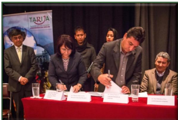
Firma de Acuerdo con la Subgobernación de Cercado

Una de las intervenciones clave del proyecto, ha sido el establecimiento de una alianza estratégica con las sub gobernaciones, refrendada por la firma de acuerdos de cooperación que además de especificar roles, incorporan responsabilidades para la cofinanciación del proyecto.